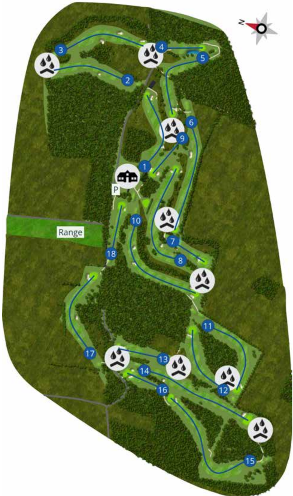
Made for Hoisdorf Golf Club with GLFR on Jun 24, 2022.