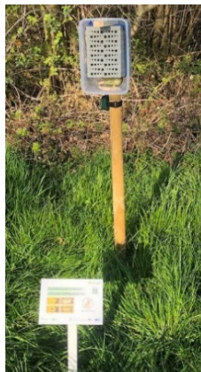
Nisthilfe am Golfclub Owingen-Überlingen e.V. Autorin: Anna Klopstock

Schon gewusst? Die Garten-Wollbiene ist ein echter Naturarchitekt! Sie baut ihr Nest aus sorgfältig gesammelten Pflanzenhaaren – ein beeindruckendes kleines Kunstwerk der Natur. Schauen Sie mal unten – so sieht eines dieser besonderen Nester aus!